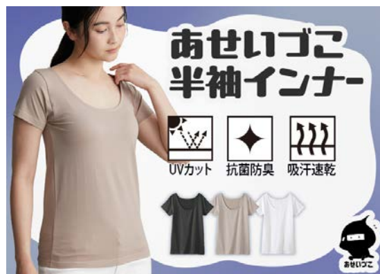
あせいづこ 半袖インナー(吸汗速乾・UVカット・抗菌防臭)